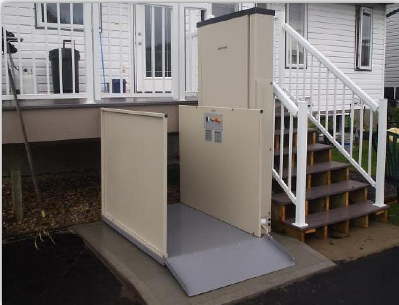
Zgornja vrata integrirana v ograjo