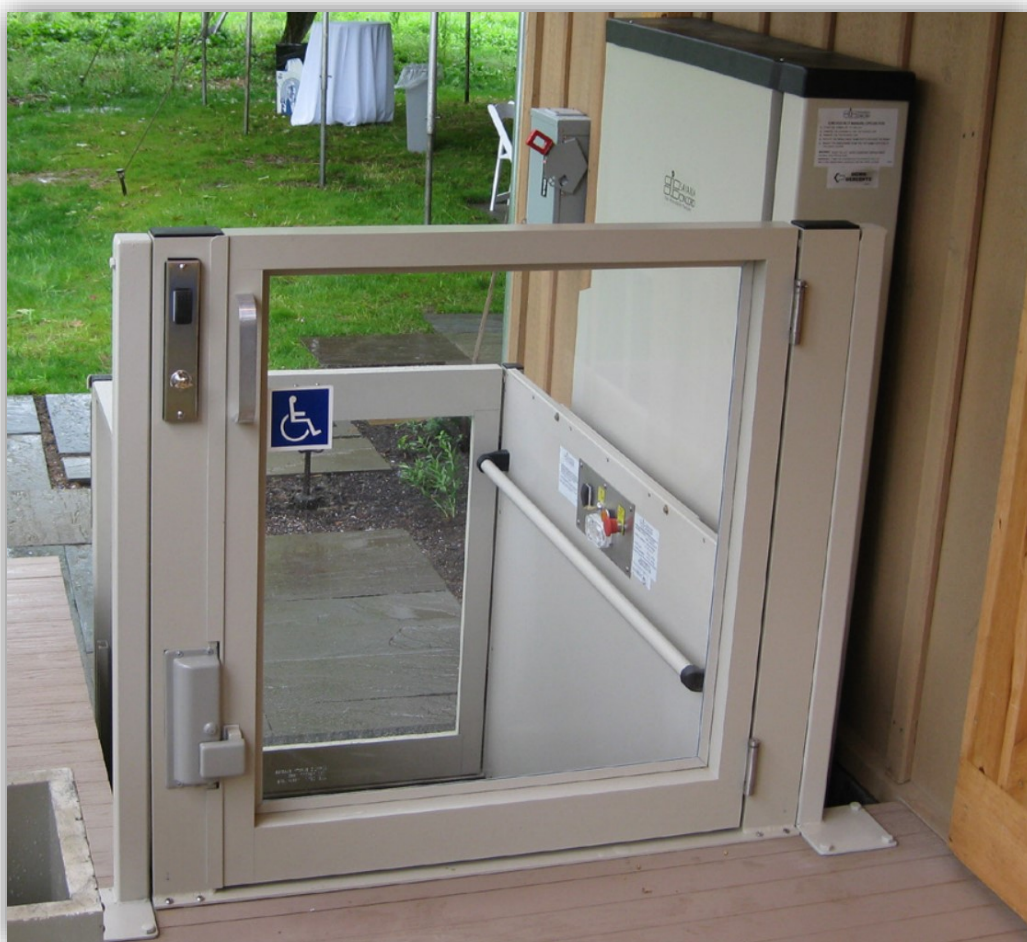
Zgornja vrata s pleksi steklom